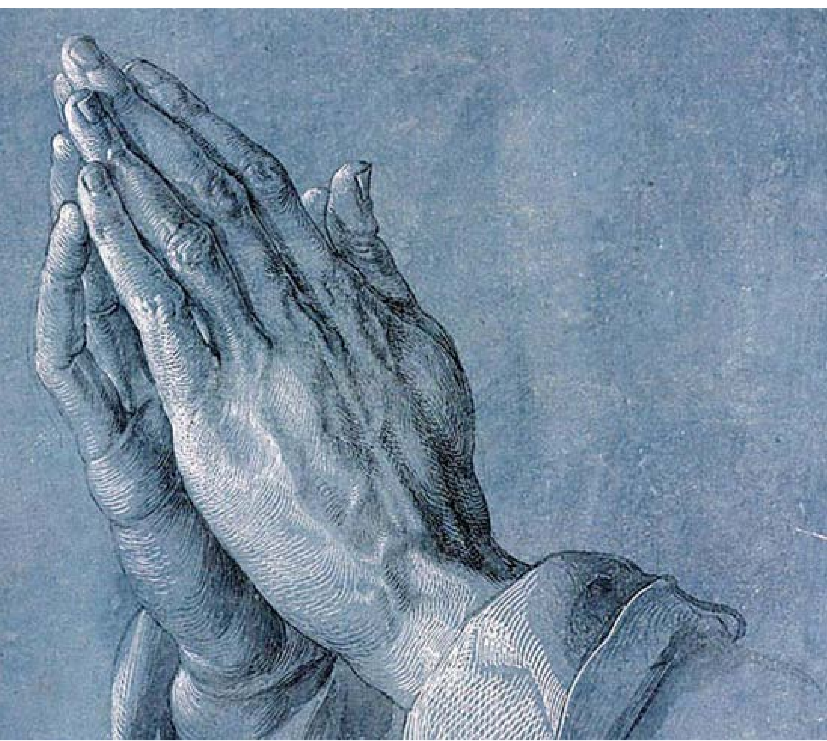
„Modlące się ręce”, rysunek Albrechta Dürera

Sobota, 25 lutego: „Kiedy się modlicie... wasz Ojciec jest obecny i was widzi”