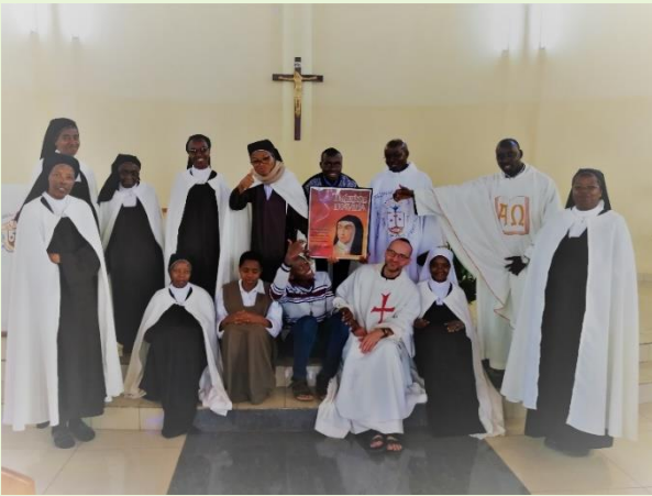
Nasza wspólnota w otoczeniu sióstr karmelitanek bosych, których klasztor mieści się tuż obok.