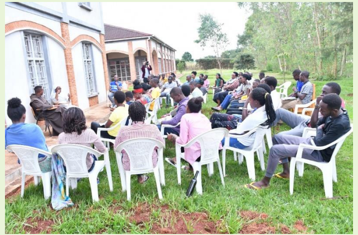
Młodzież akademicka i licealna (chórzyści oraz liderzy) w czasie jednej z sesji weekendowej organizowanej w Centrum duchowości