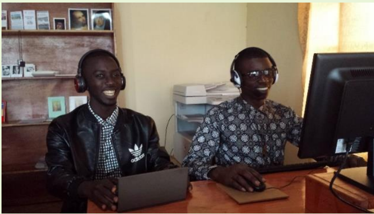
Mini-studio, gdzie przygotowywane są montaż audio i video medytacji biblijnych