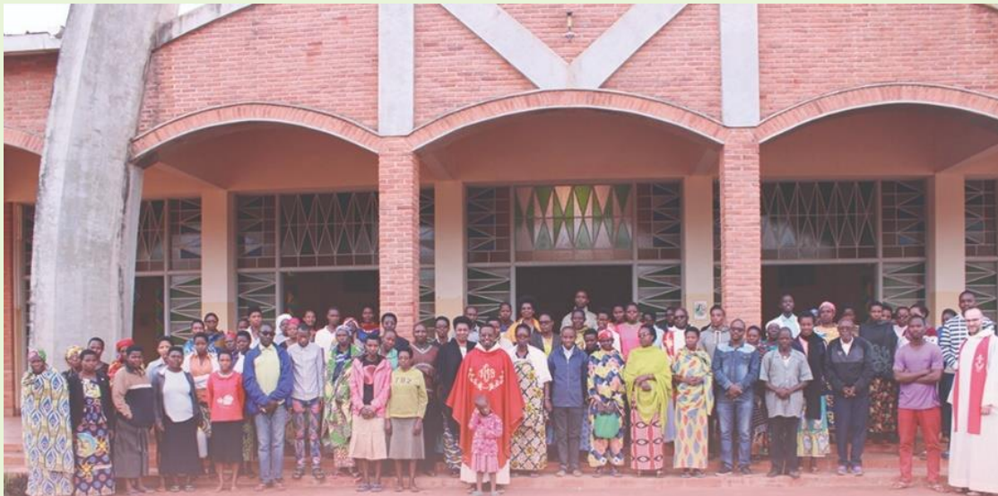
Ich modlitwa stanowi ciche, duchowe zaplecze naszej posługi.