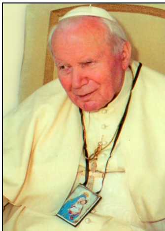
Jan Paweł II w szkaplerzu karmelitańskim, 12.09.2001

Boże, w Trójcy Przenajświętszej, dziękujemy Ci za to, że dałeś Kościołowi Papieża Jana Pawła II, w którym zajaśniała Twoja ojcowska dobroć, chwała krzyża Chrystusa i piękno Ducha miłości. On, zawierając całkowicie Twojemu miłosierdziu i maczyjnemu wstawiennictwu Maryi, ukazał nam żywy obraz Jezusa Dobrego Pasterza, wskazując świętość, która jest miarą życia chrześcijańskiego, jako drogę dla osiągnięcia wiecznego zjednoczenia z Tobą. Udziel nam, za Jego przyczyną, zgodnie z Twoją wolą, tej łaski, o którą prosimy z nadzieją że Twój sługa Papież Jan Paweł II zostanie rychło włączony w poczet Twoich świętych. Amen.